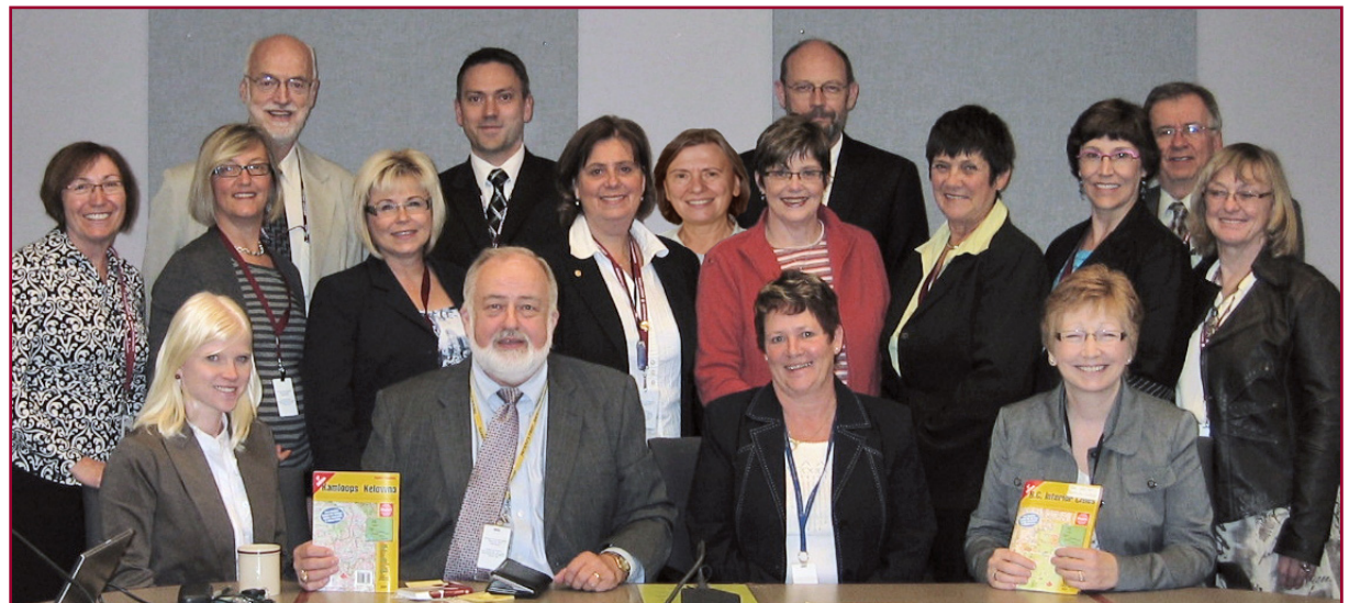
Équipe d'agrément de l'Interior Health Authority